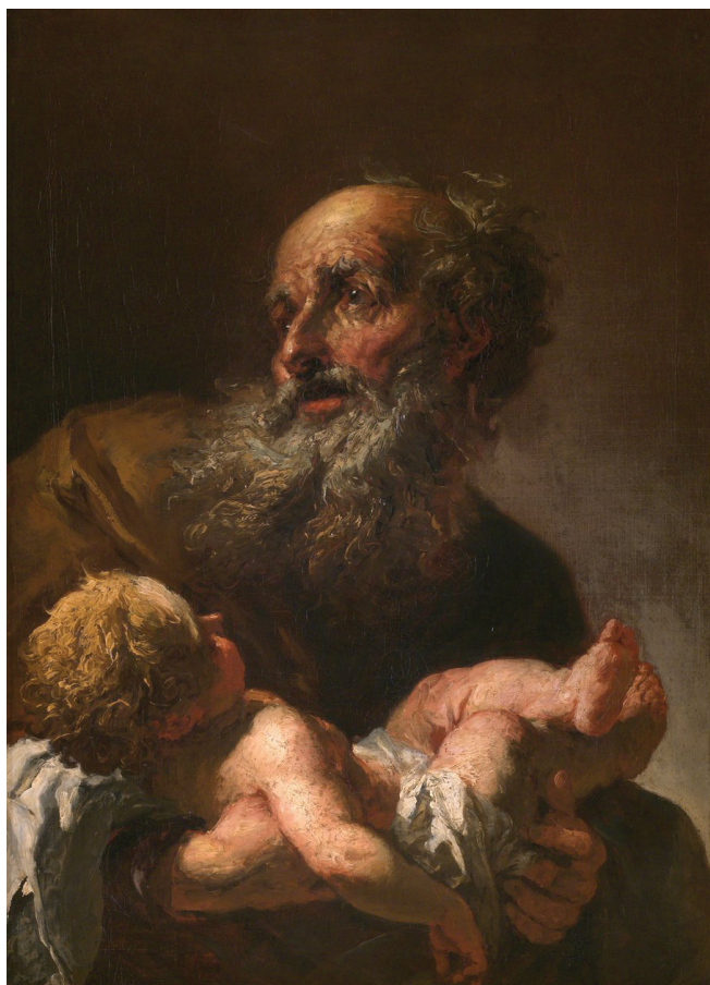
Petr Brandl, Symeon z Dzieciątkiem Jezus (1725)

Niejednokrotnie w różnych środowiskach słyszymy powiedzenie, „starość Panu Bogu się nie udała”. Co takiego można poprzez to rozumieć? Czy to, że ciało odmawia posłuszeństwa, że siły już nie te, że doskwiera poczucie osamotnienia? Czy może, że jedynym wiernym przyjacielem jest telewizor, bo on zawsze dla starszej osoby znajdzie czas? W okresie, gdy wchodzimy w podeszły wiek można by było przytaczać wiele takich smutnych historii, którym na imię starość.