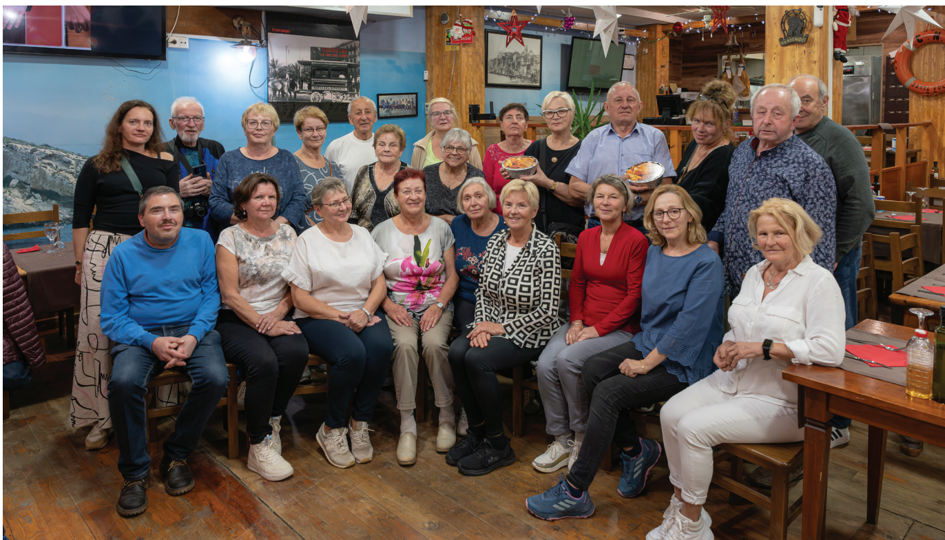
Spotkanie uczestników wyjazdu z hiszpańskimi przedstawicielami