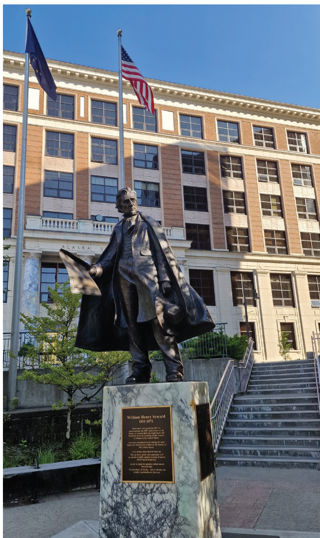
Juneau stolica Alaski - Sekretarz Stanu USA William Seward przed Senatem Stanowym

To miasto położone jest nie na stałym lądzie, a na wyspie – Revillagigedo w Archipelagu Aleksandra. Według spisu z 2020 roku liczy 8192 mieszkańców i jest szóstym co do wielkości miastem stanu Alaski. Creek Street, dzisiaj to promenada dla pieszych, jest zbudowana na drewnianych palach nad Ketchikan Creek. Sklepy, restauracje i muzea znajdują się między skalistymi zboczami, a strumieniem od którego miasto wzięło swoją nazwę. Natomiast, gdy odda-