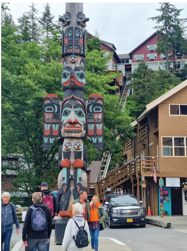
Ketchikan miasto totemów

niach. Ketchikan ma więcej totemów niż gdziekolwiek indziej na Alasce, począwszy