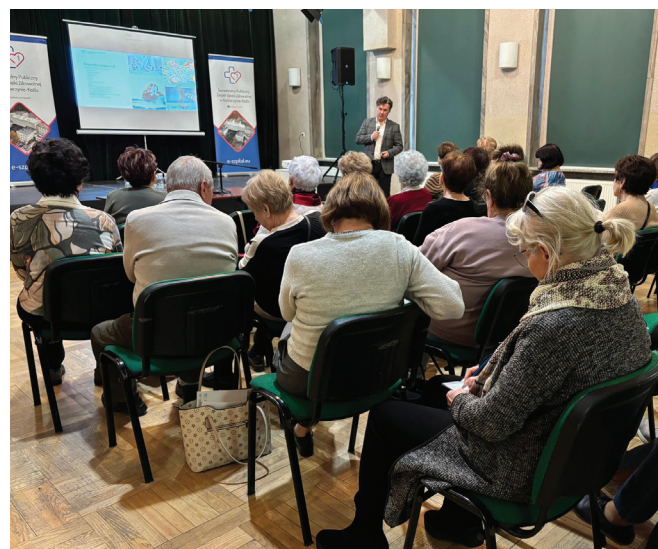
Nauki nigdy dość - wykład z profilaktyki zdrowotnej dla studentów UTW Ziemi Kozielskiej.

scy. Pamiętam taką sytuację na egzaminie z matematyki, że utknęłam na jednym zadaniu, a byłam przecież dobrą uczennicą. Moja profesorka stanęła obok mnie i chwi-