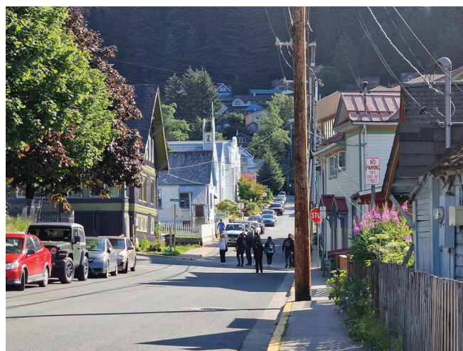
Juneau stolica Alaski

Następnego dnia dopłynęliśmy do ostatniego portu na naszej trasie wycieczkowej, Ketchikan, miasta łososia (wręcz w przewodnikach nazywanego „Światową Stolicą Łososia”) i totemów. Główna ulica Creek Street, kiedyś znana z czerwonych latarni (myślę że każdy wie o co mi chodzi – nawet jest muzeum nielegalnego niegdyś domu publicznego), dziś słynie z uroczych sklepików oraz zakładów przetwórstwa rybnego.