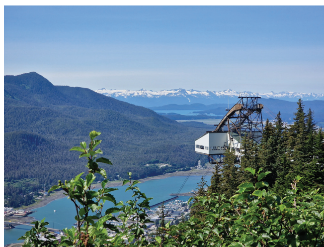
Kolejka górską, widok na Juneau i okolicę

Kultura Tlingit, rdzennych mieszkańców Alaski ma duży wpływ na dzisiejszy Ketchikan. Najbardziej zauważalnymi symbolami tradycyjnego dziedzictwa są totemy, które napotykamy na każdym kroku. Opowiadają historie o ludziach, miejscach i wydarze-